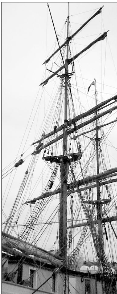
FINLAND • KAISLI SYRJÄNEN